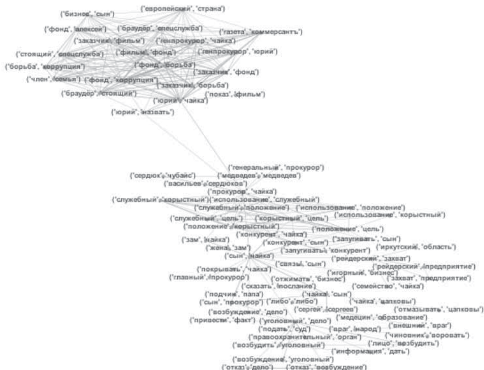
Рис. 3. Кластер 1 гигантской компоненты графа биграмм комментариев к фильму

Если сравнить темы, выделенные при помощи сетевого анализа (табл. 2) и в результате тематического моделирования (табл. 1), то получится, что в достаточной степени совпали все, кроме обсуждения роли Навального и между-