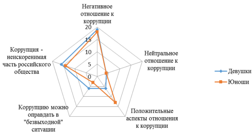
Рис. 1. Особенности восприятия коррупции в гендерном аспекте

В результате обработки фокус-групповых интервью в программе качественного контент-анализа Atlas.ti были выявлены особенности восприятия коррупции современными юношами и девушками. Расхождение позиций фиксируется в оценке положительных сторон коррупции: юноши чаще, чем девушки, воспринимают коррупцию в положительном аспекте (рис. 1). В то же время внутри группы юношей выявлена сильно выраженная поляризация мнений в оценке коррупции как исключительно негативного, либо имеющего положительные стороны социального феномена. Можно отметить, что девушки более ориентированы на оправдание