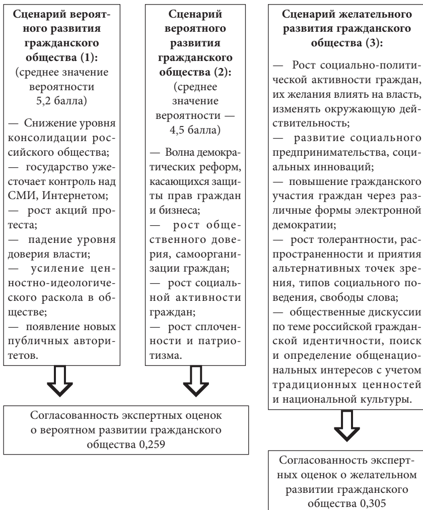
Рис. 2. Сценарии вероятного и желательного развития гражданского общества в России по экспертным оценкам