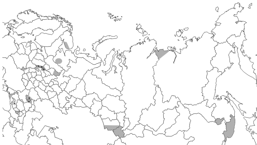
Рис. 1. География полевых исследований промышленных практик домохозяйств в 2015–2019 гг. Серой заливкой закрашены обследованные территории. Черными точками отмечены малые города, где выявлены «рассеянные мануфактуры»