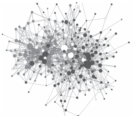
Рис. 3. Политические взгляды на сетевой карте сообщества

(в таблице слева обозначения зон — в соответствии со статьей М. Сафоновой в этом номере, любезно предоставившей его автору, бинарная классификация — по медианному респонденту, размер — в соответствии с числом входящих связей)