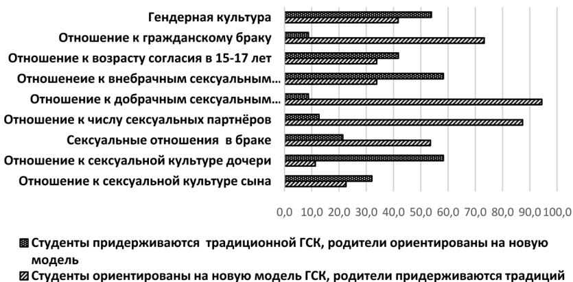
Диаграмма 2. Влияние «суррогатной культуры» на представление студентов о сексуальных отношениях (% по группам, 2022 г.)