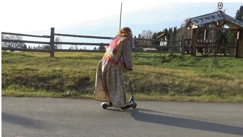
Рис. 2. Асфальтовая дорога к этноцентру. Кадр из фильма 2022 г. «Музей под открытым небом Чумэл чвэч глазами бабы Яги». Баба Яга на самокате едет ко входу в музей по идеально ровному асфальтовому покрытию

проходящих под трассой ручьев, а также на участках, окруженных болотинами, на дороге образовывались непроезжие участки, на которых колеи разъездили в несколько сот метров или километр, легковые машины и даже полноприводные джипы увязали в смеси глины и намокшего песка. На этом участке работал тракторист, за плату вызволявший автомобили из грязевого плена. Весна, прошедшая почти без дождей, сохранила дорогу в более сносном состоянии, и большинству машин не требовался этот «сервис». Тогда тракторист пригнал бочку с водой на прицепе и начал поливать водой особенно рискованные участки, чтобы его услуги вновь стали нужны как местным жителям, так и туристам, командировочным. Затея была пресечена на корню менее чем через час: новость разнеслась по округе, и местные мужчины из обоих населенных пунктов приехали, чтобы остановить разрушение и без того худого дорожного полотна.