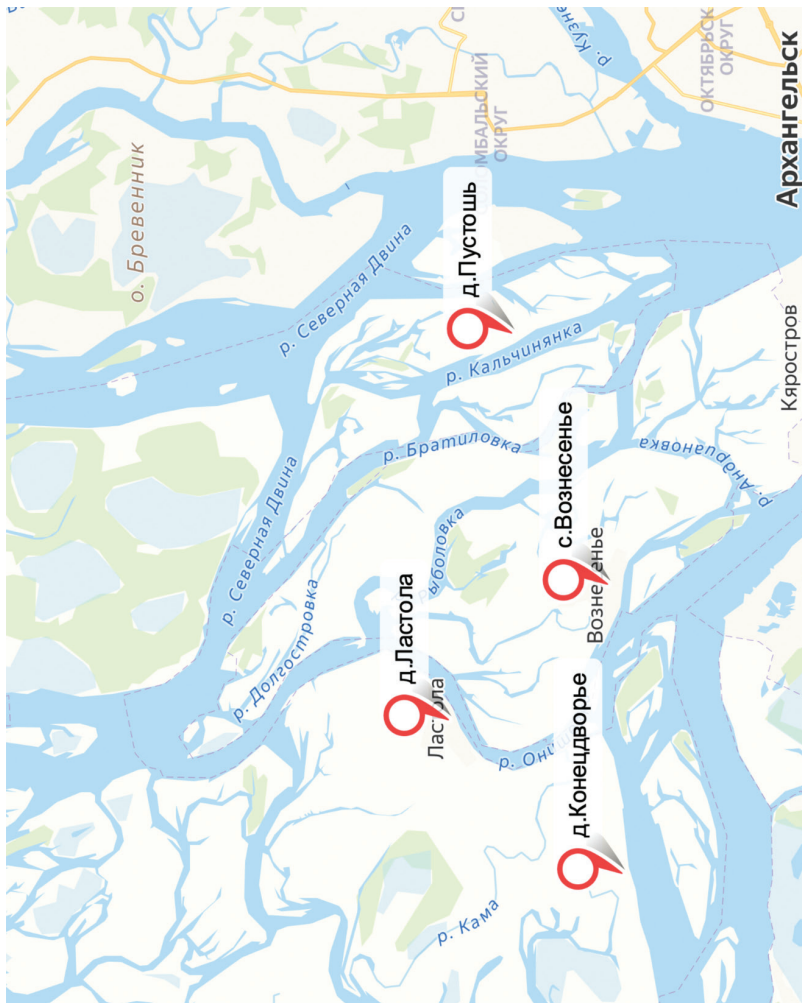
Рис. 1. Муниципальное образование «Островное»