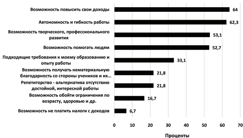
Рис. 3. Распределение ответов на вопрос «Что вам дает репетиторство и не дает другая работа?» (%) (вопрос предполагал множественный выбор ответов)

Для выявления личного видения репетиторами своей деятельности им были предложены парные высказывания, распределение ответов на которые представлены в таблице 4. Как оказалось, для 41,4 % опрошенных репетиторство — это хороший доход сегодня, для 45,6 % — стратегия выживания и способ заработка, 39,3 % отметили, что репетиторство для них — это способ проявить предпринимательскую инициативу и квалификацию. Помимо этого, 79,4 % считают, что репетиторская деятельность необходима обществу, поскольку дополняет государственную систему образования и компенсирует ее недостатки. Как и предполагалось, большинство репетиторов — сторонники стабильной ситуации на рынке