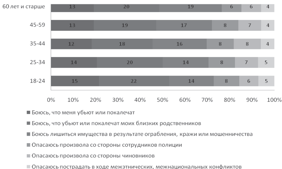
Рис. 1. Особенности восприятия социальных рисков и криминальных угроз различными возрастными группами населения (в % от групп)

Предприниматели и руководители организаций в меньшей степени, нежели представители других профессиональных групп, чувствуют страхи по поводу болезней. Кроме того, в этой группе заметно больше, чем в среднем по выборке, тех, кто испытывает опасения по поводу произвола со стороны полиции и чиновников.