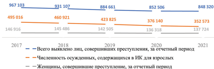
Рис. 1. Динамика женской преступности в России за период с 2017 по 2021 г.

Источники: (Ежемесячный сборник о состоянии преступности в России; Статистические данные: характеристика осужденных)